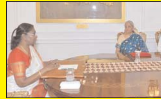
बजट: वित्तमंत्री संग राष्ट्रपति की बैठक