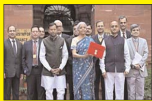
बजट पेश करने के पूर्व फोटो सेशन