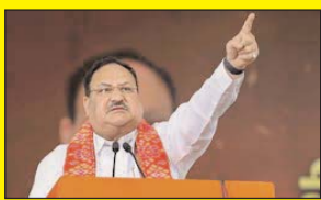
जेपी नड्डा रविवार को चेन्नई में भाजपा की रैली को संबोधित करेंगे