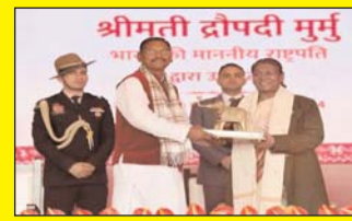
राष्ट्रपति द्रौपदी मुर्मू ने आदि महोत्सव का उद्घाटन किया