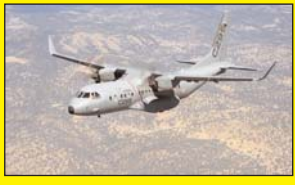
रक्षा मंत्रालय ने 15 गश्ती विमान खरीदने को दी मंजूरी