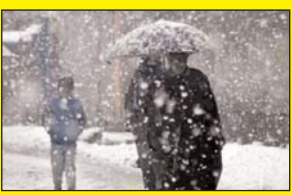
जम्मू में बरस रही है बर्फ