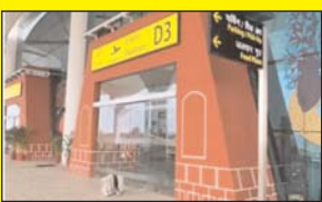
जबलपुर - प्रधानमंत्री नरेंद्र मोदी 29 फरवरी को उड़ानी करे हुए सूर्य विमान की नई टर्मिनल बिल्डिंग का लोकार्पण