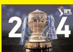
आईपीएल का 22 वां फाइनल होगा आज, पहले मैच में मिथुन चेन्नई-आर सीडी