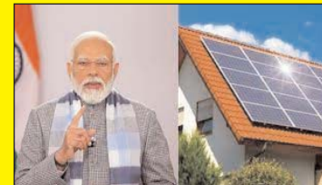
पीएम-सूर्य घर: मुफ्त बिजली योजना के लिए पंजीकरण करने वाले एक करोड़ से अधिक परिवारों की सहानुभूति