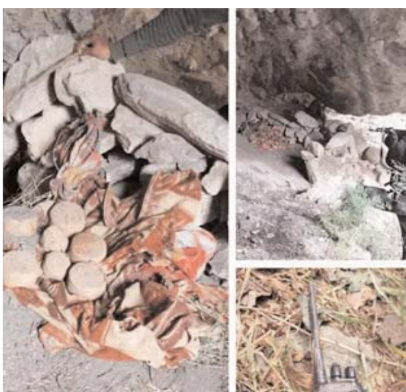
कि इस ठिकाने का इस्तेमाल दो दशक पहले क्षेत्र में सक्रिय

एजेंसी। जम्मू-कश्मीर के पुंछ में सुरक्षाबलों ने रविवार को सात आईईडी बरामद किए। इससे एक बड़ी त्रासदी टल गई। पुलिस ने बताया, राष्ट्रीय राइफल्स और स्थानीय पुलिस की एक टीम ने तलाशी अभियान के दौरान जिले के सुनकोट तहसील के दारा सांगला इलाके से आईईडी और एक वायरलेस सेट बरामद किया। पुलिस ने कहा कि सुरक्षा बलों ने इलाके से सभी आईईडी को सुरक्षित हटा दिया है। आईईडी एक मंदिर के नजदीक पाए गए थे। इन विस्फोटक उपकरणों की समय पर बरामदगी से एक बड़ी त्रासदी टल गई, क्योंकि मंदिर में स्थानीय लोगों की भीड़ होती है। अधिकारियों कहना है कि कि प्रारंभिक जांच से पता चलता है