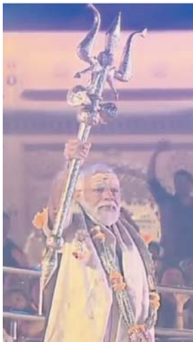
पीएम ने त्रिशूल उठाया और हर-हर महादेव का जयघोष किया।

एजेंसी प्रधानमंत्री नरेंद्र मोदी 2 दिन के यूपी दौरे पर हैं। शनिवार देर शाम पीएम काशी पहुंचे थे। यहां उन्होंने बाबतपुर एयरपोर्ट से करीब 30 KM का रोड शो किया। इसके बाद पीएम काशी विश्वनाथ धाम पहुंचे। काशी विश्वनाथ मंदिर के गर्भगृह में बाबा का 30 मिनट तक पूजन किया।