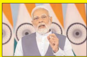
पीएम मोदी 12 मार्च को पोखरण में भारत शक्ति अभ्यास देखेंगे