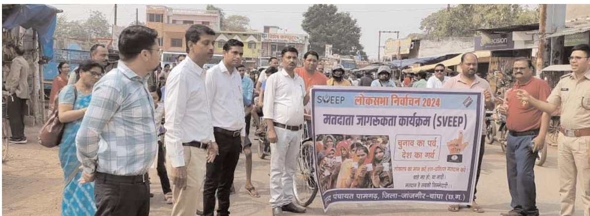
मतदाता जागरूकता कार्यक्रम का हुआ आयोजन