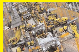
औद्योगिक उत्पादन ने पकड़ी रफ्तार, फरवरी में कोर सेक्टर में 6.7 प्रतिशत की वृद्धि

कर्पूरी ठाकुर, नरसिम्हा राव, स्वामीनाथन, चौधरी चरण सिंह दिवंगत नवाजे गये भारत रत्न से