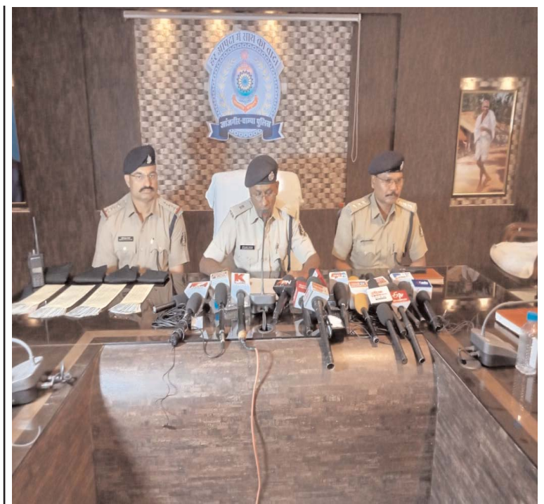
मनका दाई मंदिर चोरी का हुआ खुलासा: उड़ीसा से पकड़े गए चार चोर