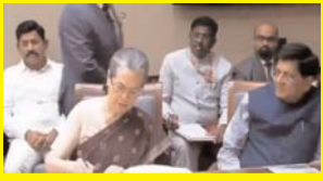
सोनिया गांधी, अश्विनी वैष्णव सहित 14 लोगों ने ली राज्यसभा सदस्य के रूप में शपथ