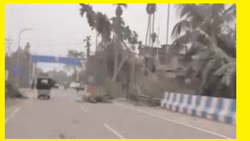
पश्चिम बंगाल में तूफान ने मचाई भीषण तबाही, 4 की मौत, 100 लोग घायल