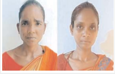
दो इनामी महिला नक्सली गिरफ्तार ग्रामीण की हत्या और अन्य मामलों में थी शामिल

ग्रामीण क्षेत्रों में युवाओं को बनाता था निथाना, अन्य आरोपियों की तलाश