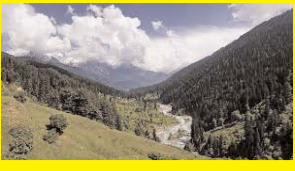
जम्मू-कश्मीर में महसूस किए गए भूकंप के झटके, रिक्टर स्केल पर 3.8 रही तीव्रता