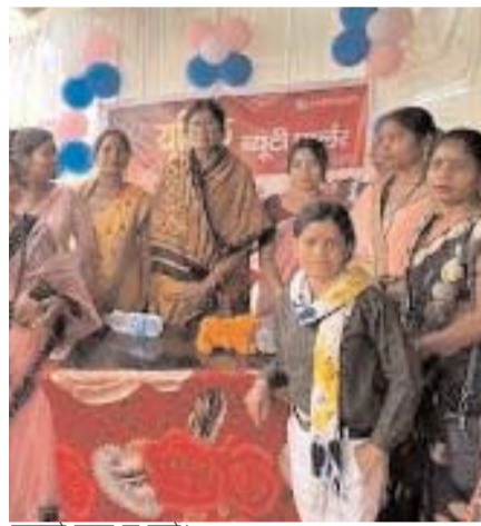
मुझसे बात न कर।

कोरबा, 05 अप्रैल (आरएनएस)। कोरबा लोकसभा से कांग्रेस प्रत्याशी व सांसद श्रीमती ज्योत्सना चरणदास महंत ने अपना चुनावी जनसंपर्क जोर-शोर से जारी रखा है। वे समर्थकों व पदाधिकारियों के साथ शहर से लेकर ग्रामीण क्षेत्रों में लगातार दौरा कर रही हैं एवं कांग्रेस सरकार की उपलब्धियों को बताने के साथ-साथ भावी योजनाओं की रूपरेखा भी सामने रख रही हैं। सांसद ने शिवाजी नगर, गेवरा बस्ती के हनुमान चैक, ग्राम बोईवा सहित अन्य क्षेत्रों का दौरा किया। उपस्थितजनों के द्वारा सांसद का परंपरागत स्वागत व अभिवादन किया गया। इस अवसर पर ज्योत्सना महंत ने कहा कि लोकतंत्र हमारे देश का मंदिर है जहां हम जनता के हित की बात करते हैं, जनता के मुद्दों को लेकर जाते हैं लेकिन बीजेपी वालों ने इस मंदिर को भी मजक बनाकर रखा है। जनता के हित के लिए जब उनके मंत्रियों से बात करते हैं तो बात टाल दी जाती है। आंगनबाड़ी कार्यकर्ता, मितानिन, रसोईयां बहनों महिलाओं एवं बच्चों की सेवा करती है, इनका मानदेय बढ़ाना चाहिए तो इस विषय में स्मृति ईरानी ने साफमना कर दिया कि इस विषय में