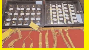
श्री सिद्धिविनायक गणपति भगवान को चढ़ाए गए सोने के गहनों की होगी नीलामी