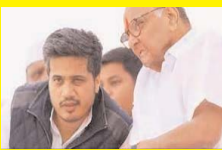
एमएससीबी घोटाला: ईडी ने टारट पवार के पोते की 50 करोड़ रुपये से अधिक की संपत्ति कुर्क की