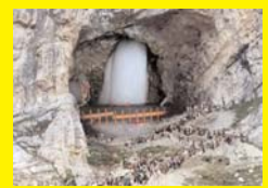
अमरनाथ यात्रा: तापेख का हुआ ऐलान, 53 दिन तक चलेगी यात्रा, इस दिन से शुरू होगा पंजीयन