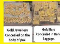
गुर्बाई एयरपोर्ट पर पकड़ गया 6 करोड़ से ज्यादा का सोना, 3 तस्क़र हुए गिरफ्तार