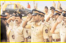
सलमान खान के घर पर फायरिंग मामले की जांच करेगी गुर्बाई क्राइम ब्रांच